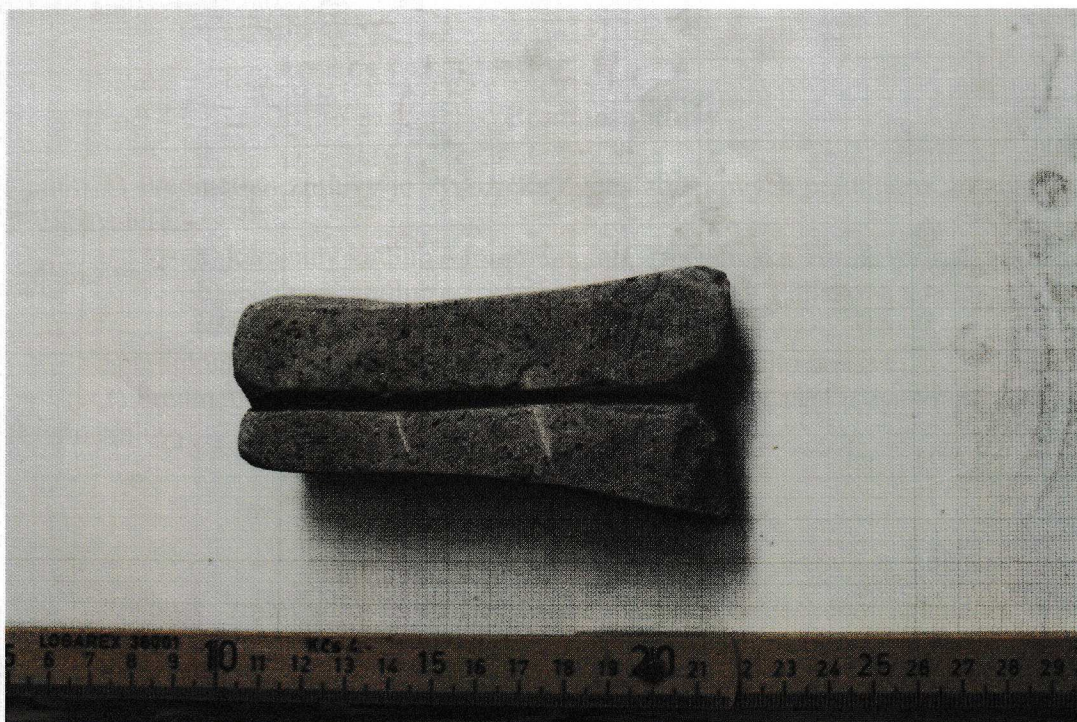
2) kamenný kadlub – fragment, lok. Trenčín – Pollakova tehelňa, ev. č. A3249